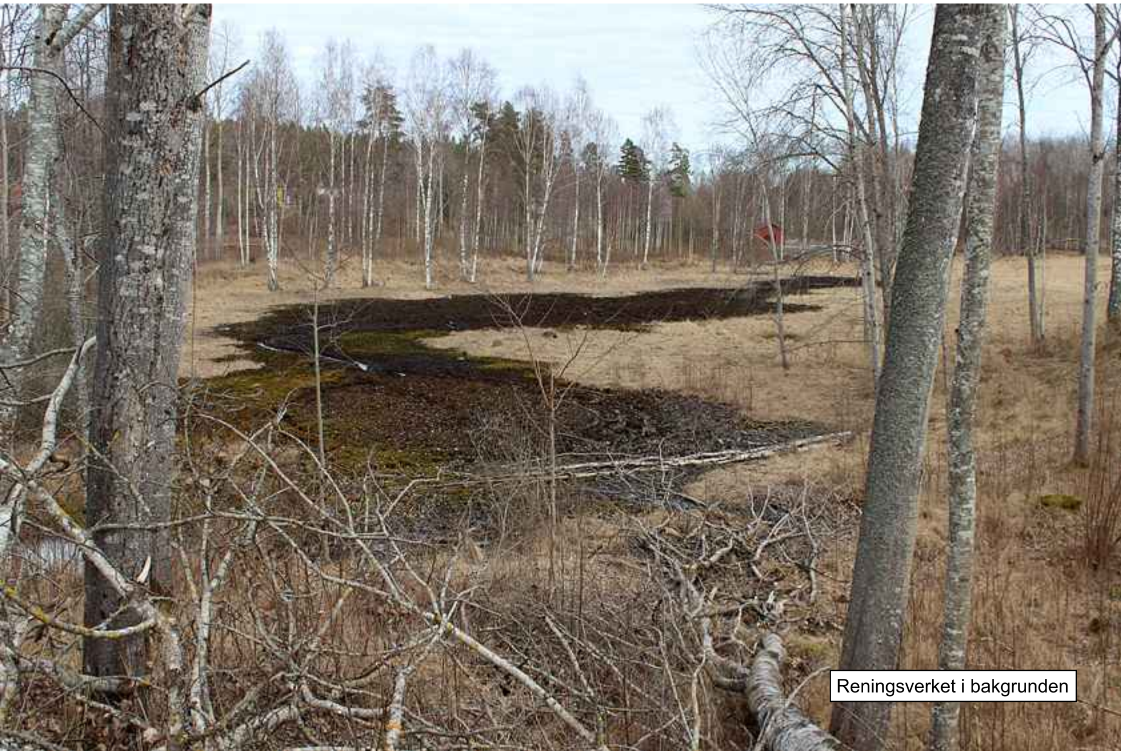
Reningsverket i bakgrunden