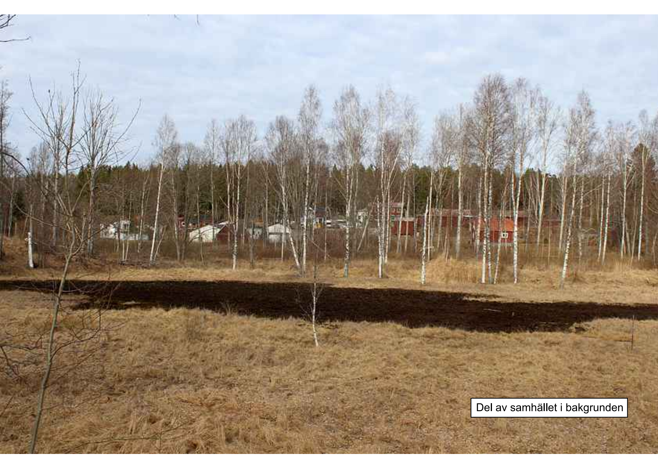
Del av samhället i bakgrunden