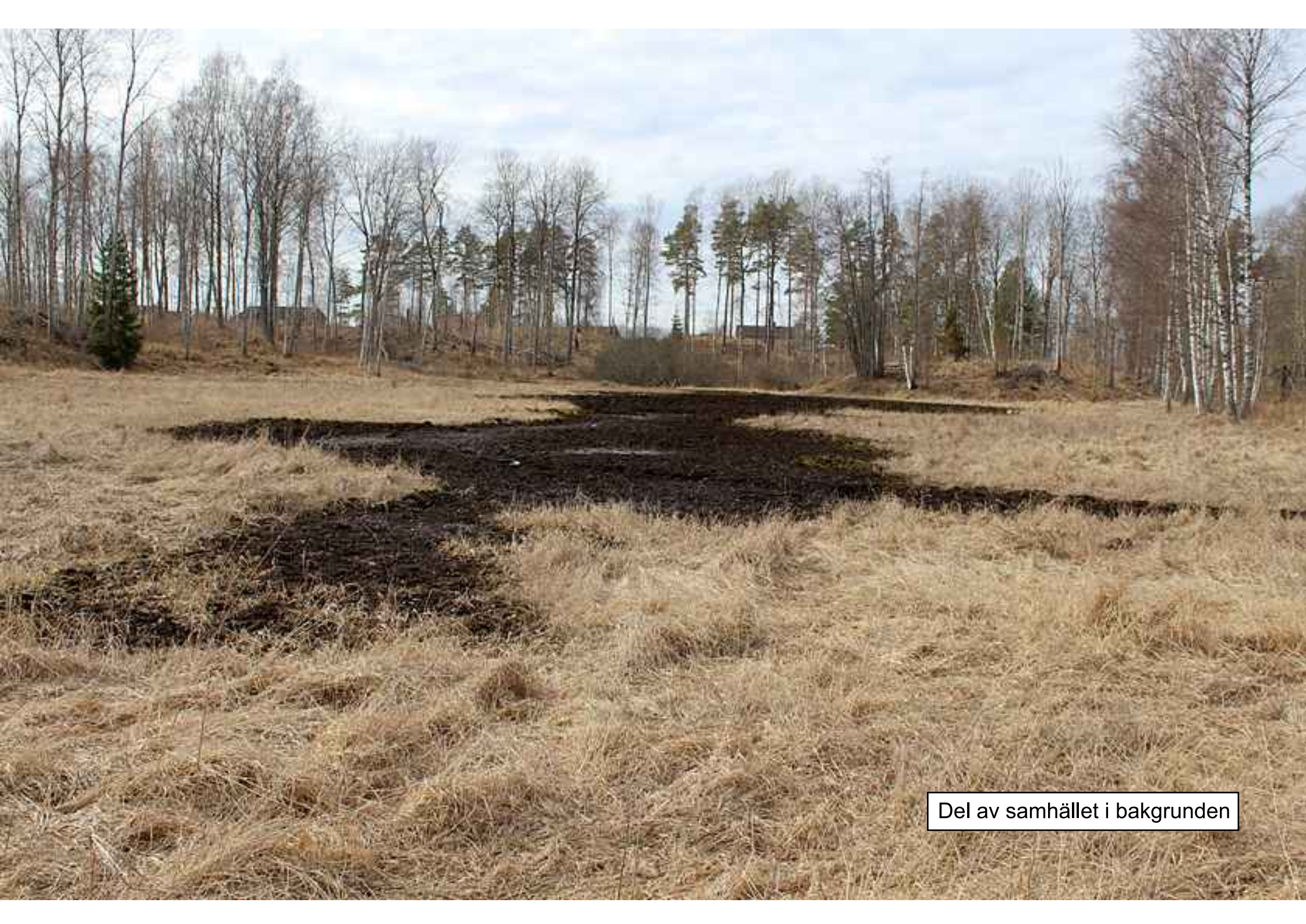
Del av samhället i bakgrunden