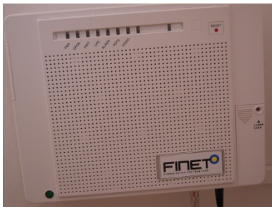
Exempel på utrustning som monteras i hemmet.

En konverter (CPE) installeras i fastigheten där framdragen fiberkabel ansluts. Vilket gör det möjligt att beställa tjänster som finns i Finets Stadsnät. Att tänka på: Vid placering av konverter behövs det lite luft runt konvertern för att kunna ansluta kablar till denna. Då det ska anslutas kablar från nya eller befintliga datorer, telefoner och tv-apparater, så tänk på att du har bra kabelvägar därifrån.